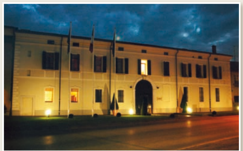
Nuova Sede Palazzo Municipale - Foto Zorza