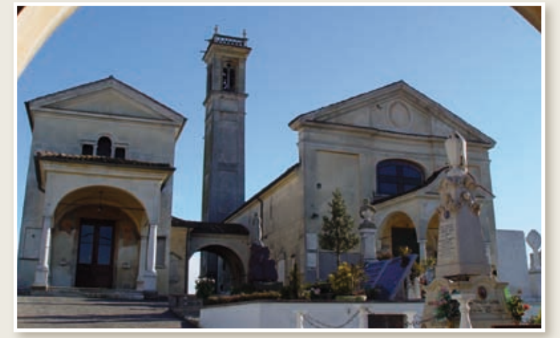
Chiesa Pieve