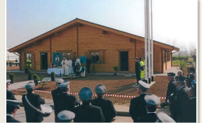
Sede Civica Geom. D. Lasio: sede del Gruppo Comunale di Protezione Civile e dell'Associazione Arma Aeronautica